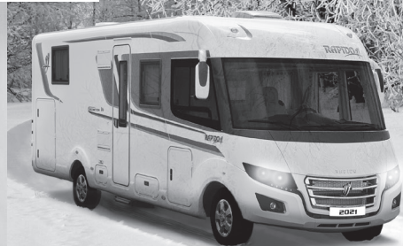
RAPIDO 2021 mer skandinavisk enn aldri før