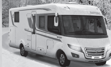
RAPIDO 2021 mer skandinavisk enn aldri før